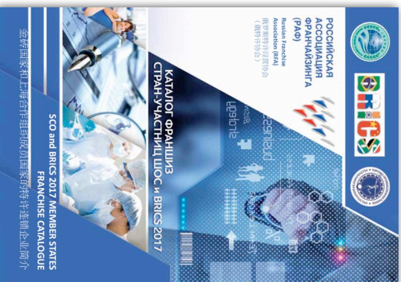
Каталог ШОС БРИКС на русском, английском и китайском языках

Каталоги и справочники, как правило выпускаются национальными ассоциациями франчайзинга. Российская ассоциация франчайзинга (РАФ) выпустила уже 8 каталогов франшиз за последние 7 лет общим тиражом 47 000 экз. Каталоги распространяются на всех мероприятиях ассоциации, а также органами местного самоуправления на местах. Кроме печатного каталога ассоциации существуют каталоги выставок. Наиболее известный каталог выставки ВУВВРАНД EXPO. Стоимость размещения в каталоге РАФ - от 50 т.р.