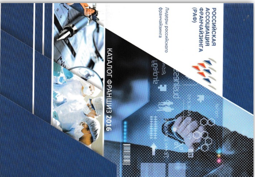
Ежегодный каталог-справочник ассоциации РАФ